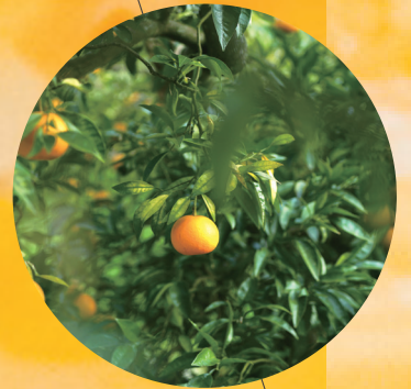
AWAJISHIMA NARUTO ORANGE